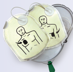
Pad-Pak et Pediatric-Pak avec électrodes pré-attachées

Faible coût de propriété La cartouche a une durée de vie de 4 ans à partir de la date de fabrication, offrant ainsi d'importantes économies par rapport aux autres défibrillateurs qui nécessitent une batterie et des électrodes séparées.